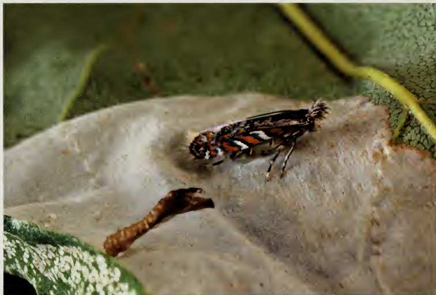
Figuren 1–3: Phyllonorycter robiniella (Clemens, 1859), pas uitgekomen exemplaren, e.l. Robinia pseudoacacia L., oktober 2002, Mol (België, provincie Antwerpen), leg. en coll. H. Henderickx.

Phyllonorycter robiniella (Clemens, 1859): Mol-Postel, 26.IX.2002, 6 bladmine op Robinia pseudoacacia (leg. H. Henderickx), Dessel, Mol-Sluis, Retie, 29.IX.2002, talrijke bladmine op R. pseudoacacia en één adult (leg. W. De Prins). De eerste vlindertjes ontpopten reeds op 30.IX.2002. Nieuw voor de provincie Antwerpen. Tijdens het uitkweken werd vastgesteld dat de motjes haast steeds rond het middaguur en tijdens de vroege namiddag ontpopten. Zoals gewoonlijk bij immigrerende soorten werden er slechts weinig parasitoïden aangetroffen. De enkele exemplaren die toch werden uitgekweekt verschenen op het einde van de kweek toen de meeste vlindertjes reeds waren ontpopt, dit in tegenstelling tot de situatie bij de meeste andere inlandse Phyllonorycter -soorten waar de parasitoïden zich tot adult ontwikkelen vóór de eerste adulte